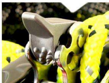
Perfil de leva cónica Enganche positivo, sin desgaste excesivo