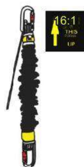
16:1 THIS RATIO UP