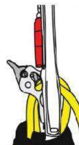
Leva desconectada para lowering