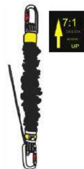
7:1 THIS RATIO UP